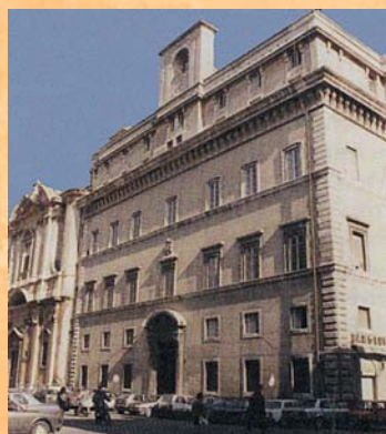
L'Université pontificale de la Sainte Croix fruit de la sollicitude de saint Josémaria pour les prêtres