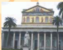
▲ Saint Paul Hors les Murs, en cette année jubilaire.

L'association des Amis de Josémaria propose aux lecteurs et amis de Tous les Chemins , la possibilité de séjourner trois jours dans la ville éternelle "guidés" par saint Josémaria.