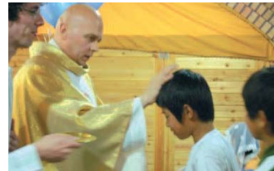
Corée du sud

Autour du 26 juin des messes ont été célébrées sur tous les continents : en Europe, à Bucarest entre autres, et, plus loin de nous, à Séoul.